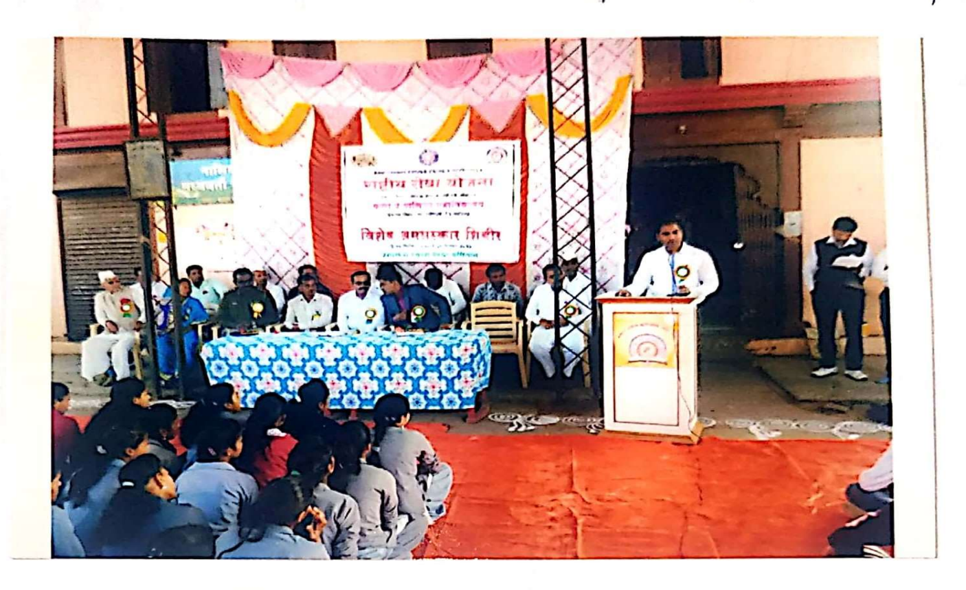
वनराई दिधारा ।