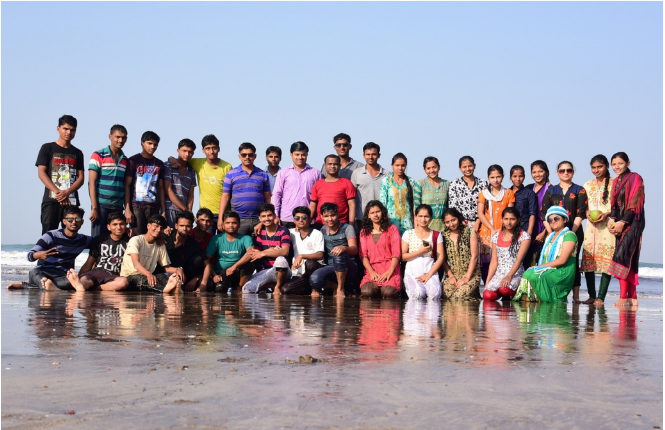
Dive Agar Beach