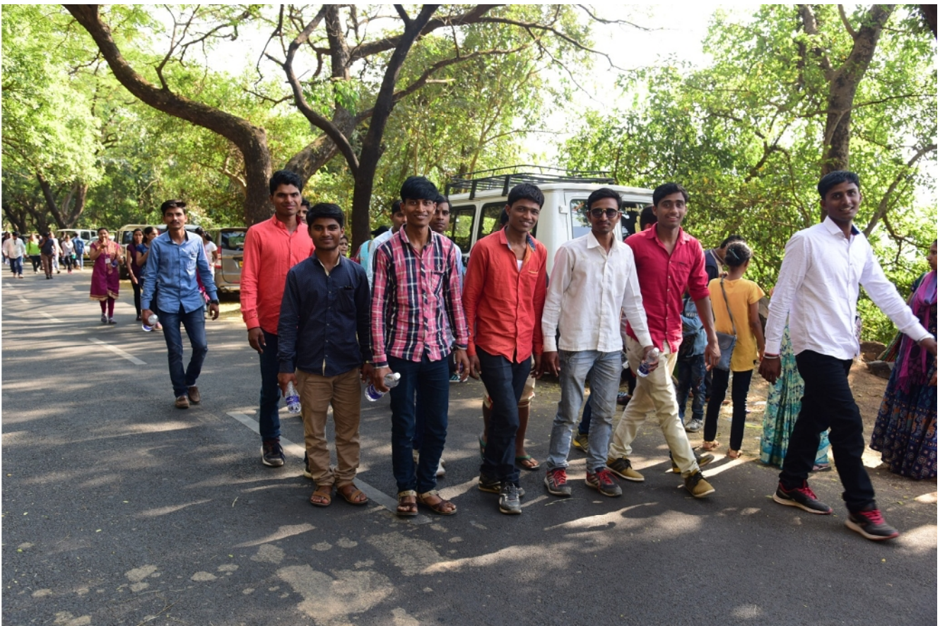
Student Claiming Raigrad Fort