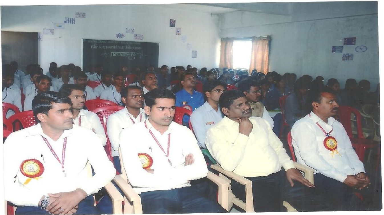
Certificate Distribution to Participants