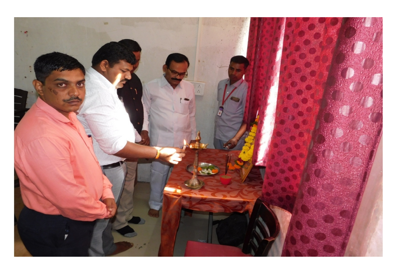
The Chief guest is opening the programme with lighting and garlanding portrait of Saraswati.