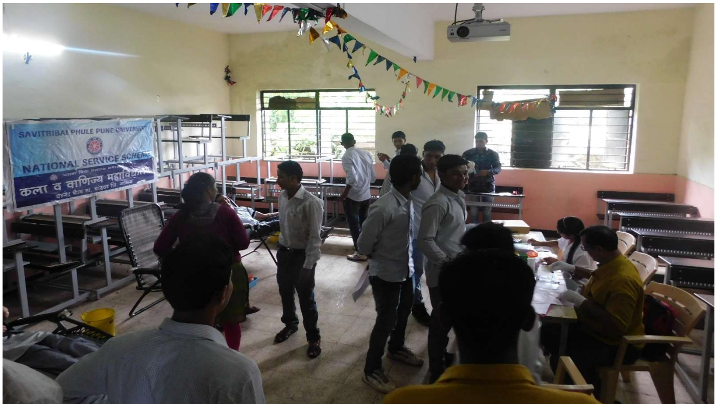
Students Participated in Blood Donation Camp :