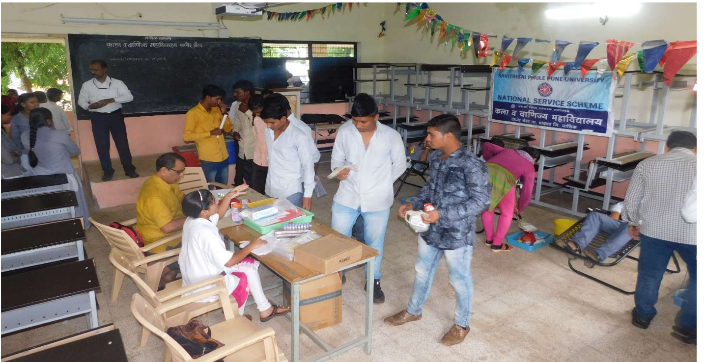
Students Participated in Blood Donation Camp :