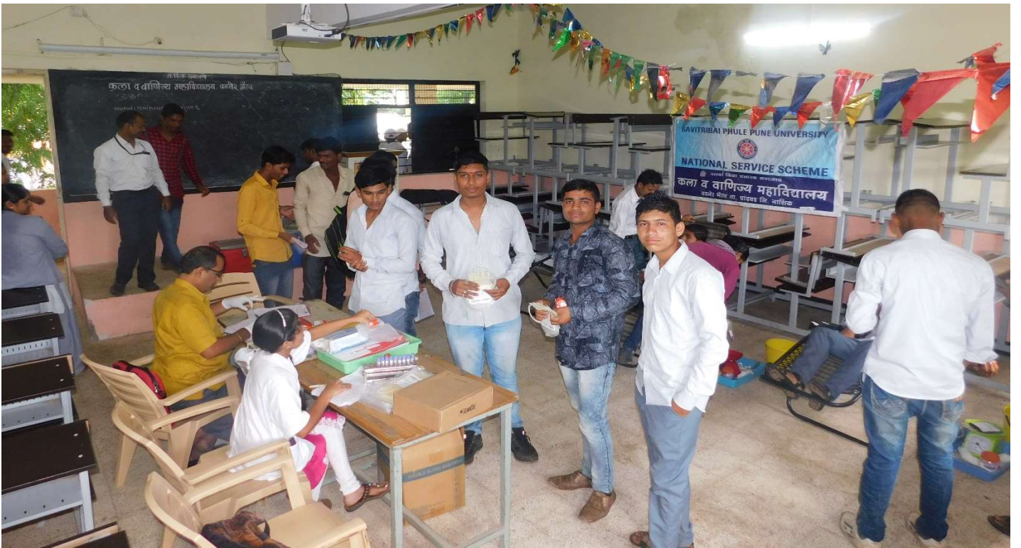
Students Participated in Blood Donation Camp :