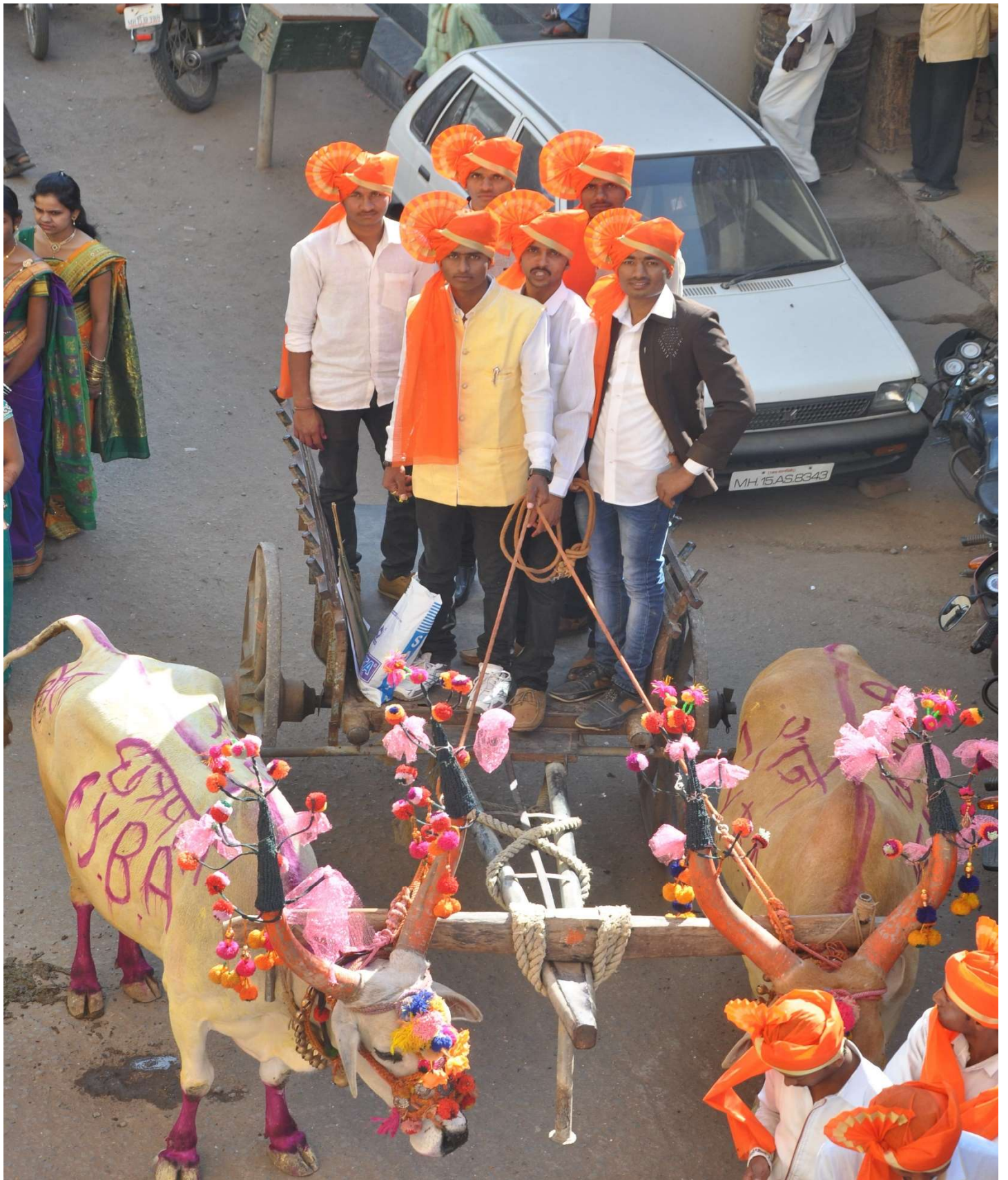
Culture of Agricultural.