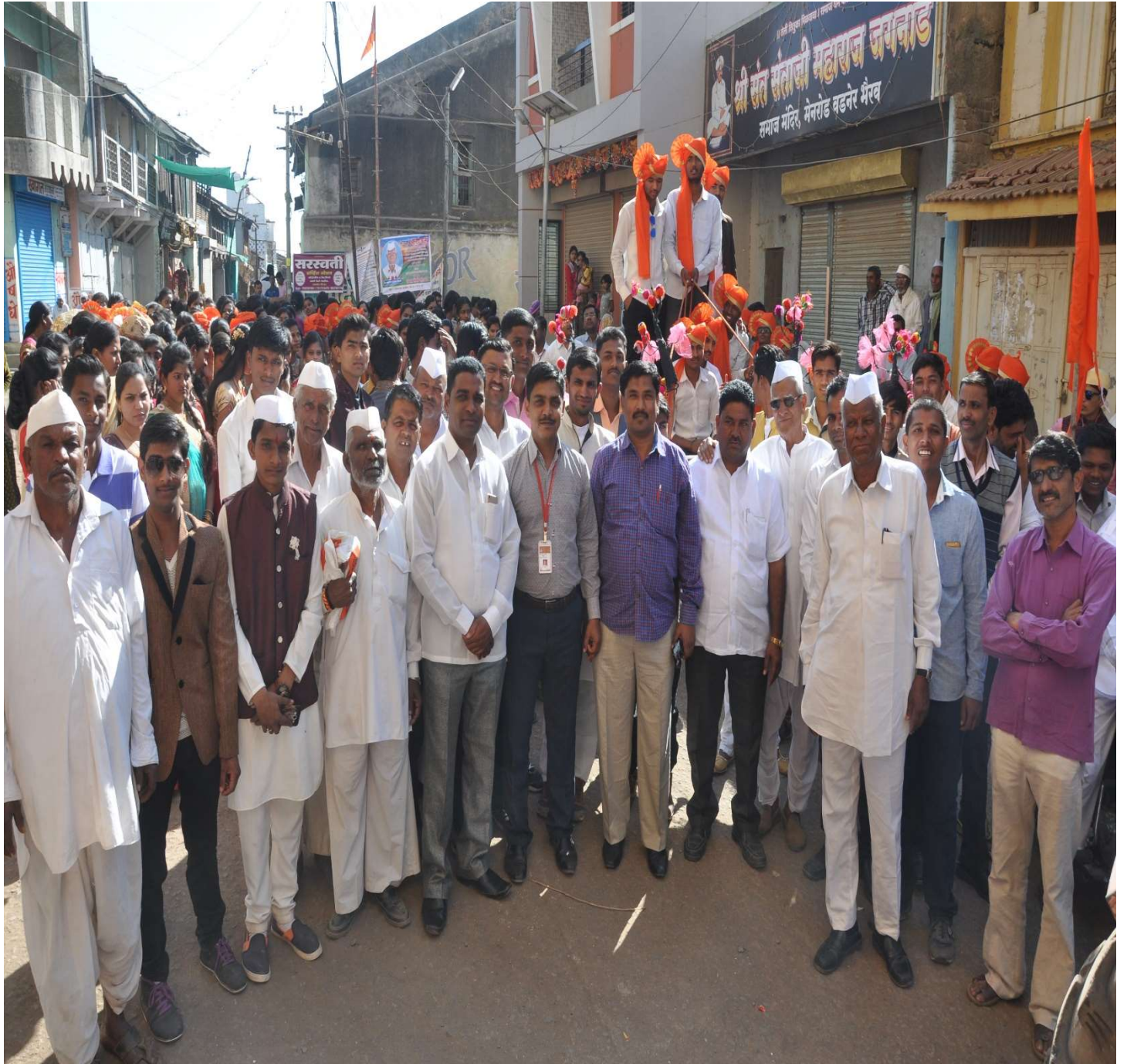
Citizens of Vadner Bhairav also participate in this activity.