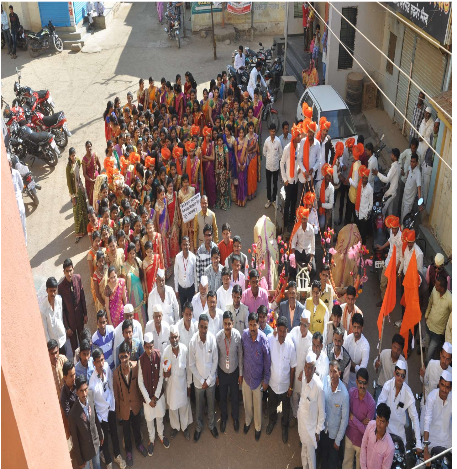
Student Participation in the activity.