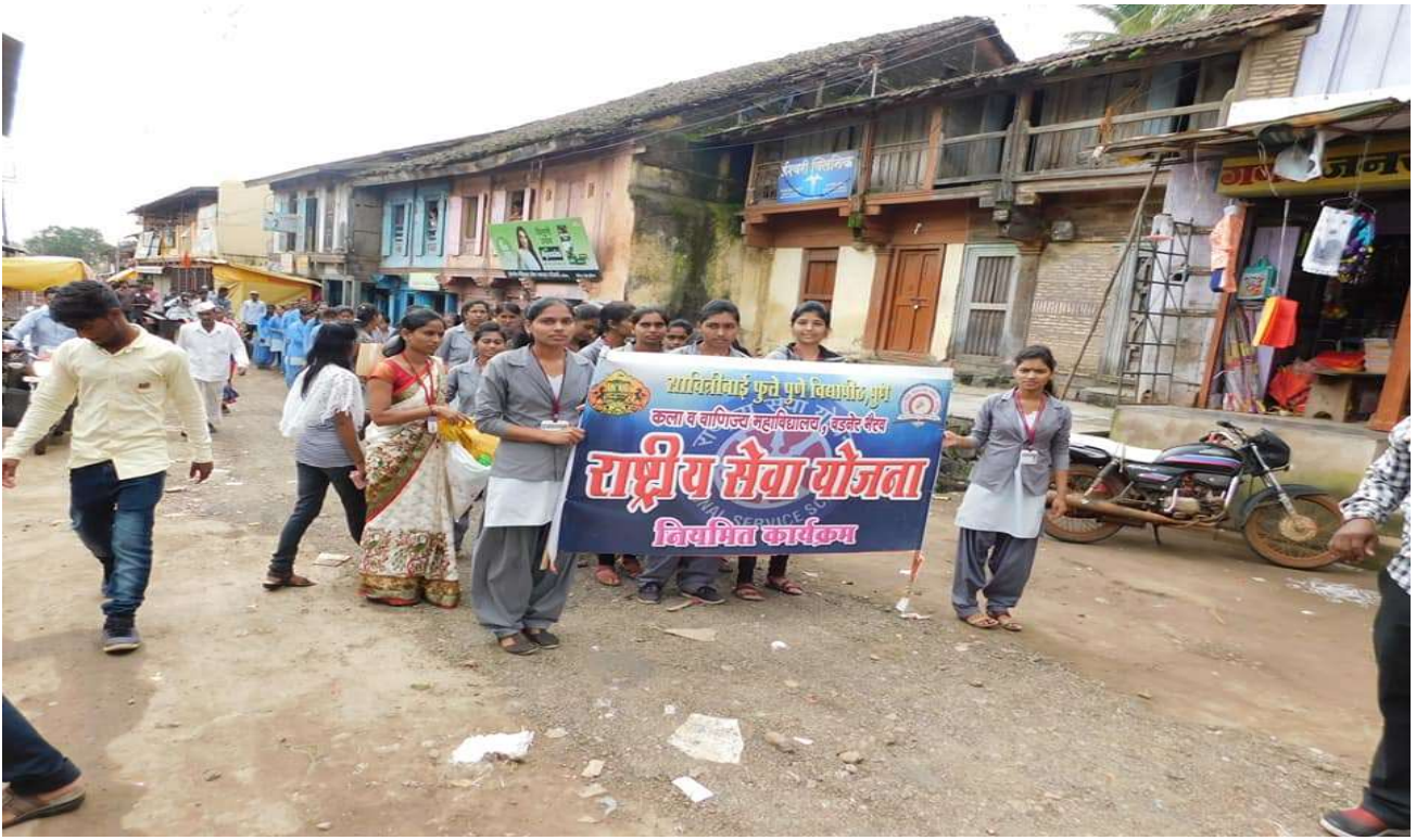
NSS Volunteers participation in Flood relief campaign / Rally at Vadner Bhairav