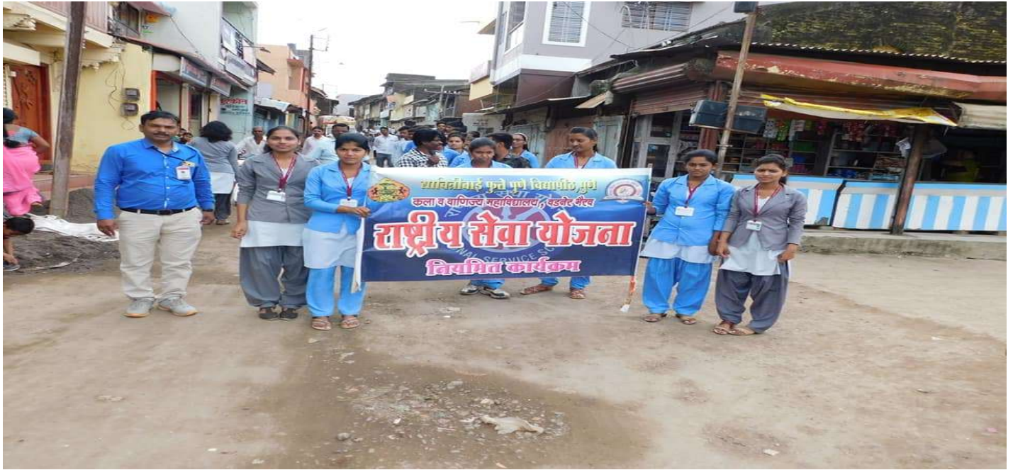
Students participation in Flood relief campaign / Rally at Vadner Bhairav