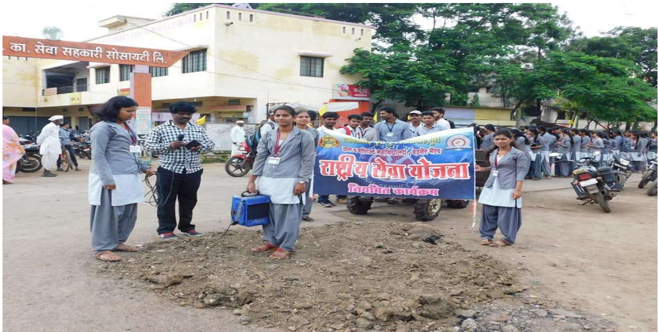
NSS Volunteers participation in Flood relief campaign / Rally at Vadner Bhairav