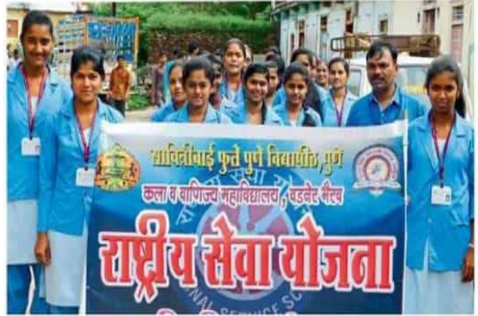
वडनेरभैरव : येथील कला, वाणिज्य महाविद्यालयाच्या राष्ट्रीय सेवा योजनेच्या विद्यार्थ्यांनी पूरग्रस्तांसाठी काढलेली मदतफेरी.