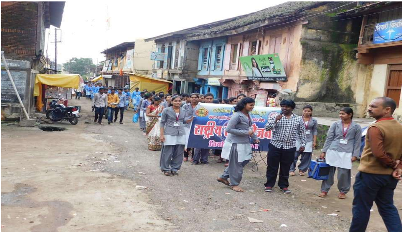
NSS Volunteers participation in Flood relief campaign / Rally at Vadner Bhairav