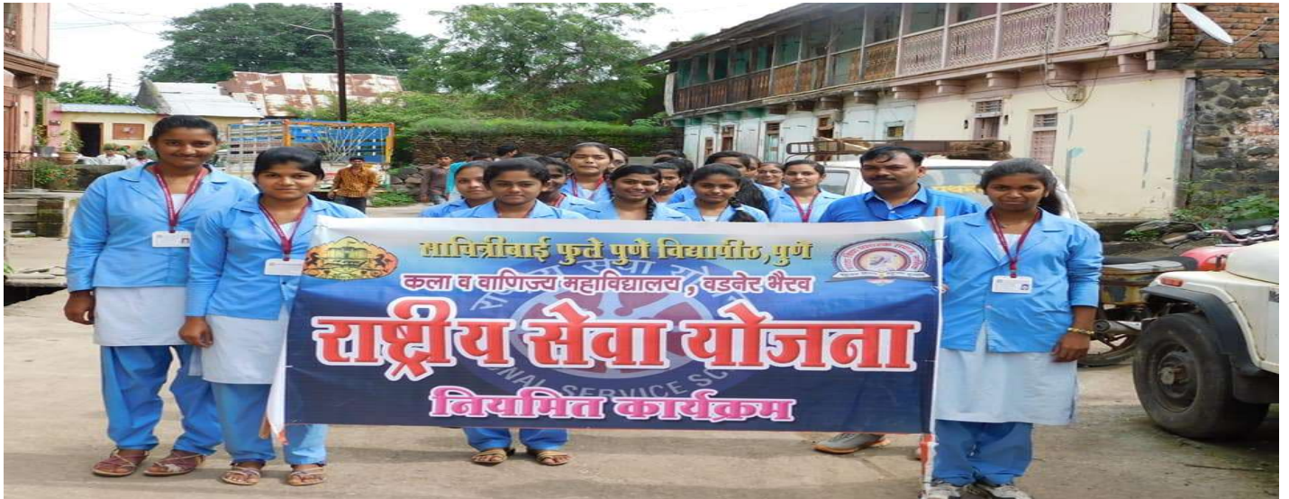
Students participation in Flood relief campaign / Rally at Vadner Bhairav