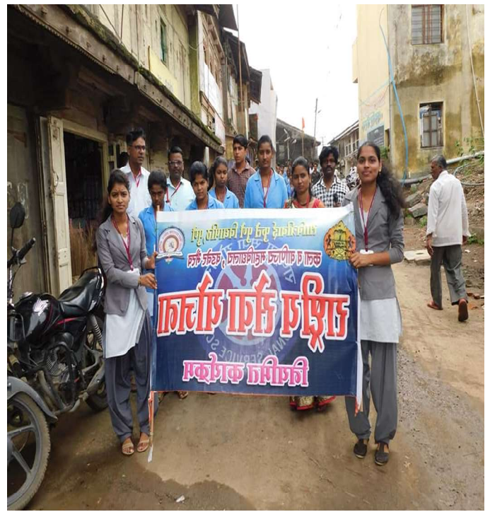
NSS Volunteers participation in Flood relief campaign / Rally at Vadner Bhairav