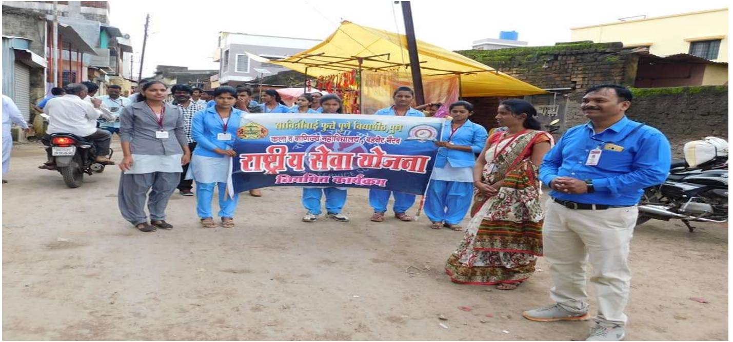
Students participation in Flood relief campaign / Rally at Vadner Bhairav