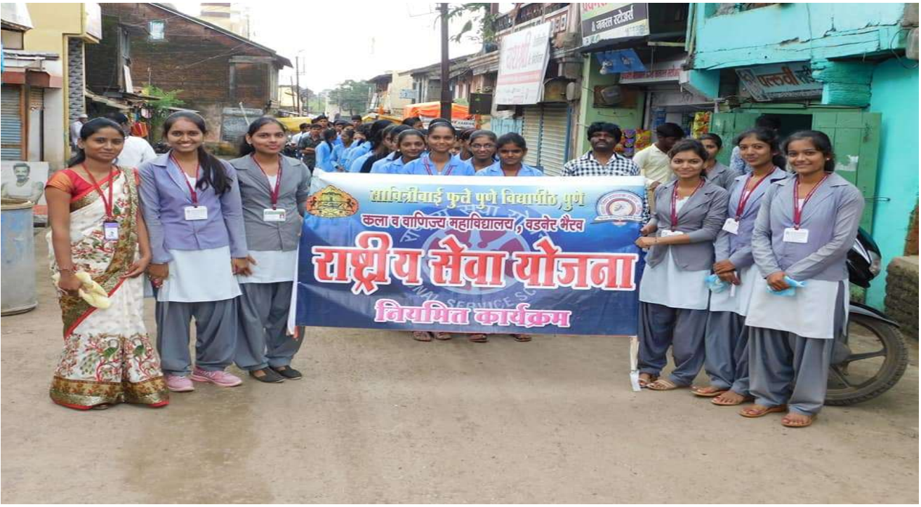
NSS Volunteers participation in Flood relief campaign / Rally at Vadner Bhairav