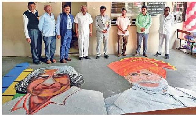
चांदवड : प्रदर्शनामध्ये विद्यार्थ्यांनी काढलेल्या रांगोळ्या.

प्रदर्शनातून विद्यार्थ्यांना नवनिर्मितीचा आनंद