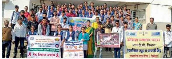
वडनेरभैरव - महाविद्यालयात रेट दिवस करून आणि रासेयोंतर्गत शुक्रवारी एड्स जनजागृती सप्ताहानिमित्त कार्यक्रमाला आलेली रेली.