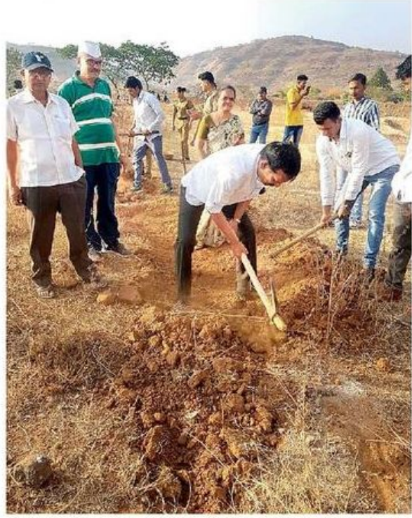
गोहरण येथे श्रमदान करताना वडनेरभैरव महाविद्यालयाचे विद्यार्थी व विद्यार्थिनी. समवेत शिक्षक.