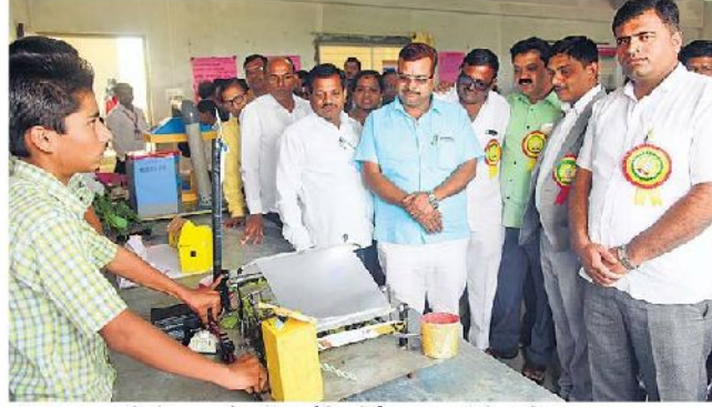
चांदवड तालुकास्तरीय विज्ञान प्रदर्शनात विद्यार्थ्यांनी काढलेल्या उपकरणांची पाहणी करताना मान्यवर.