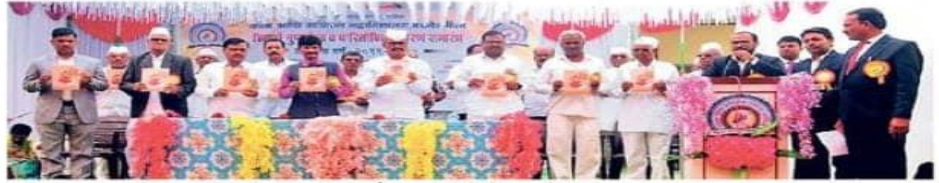
युवा सप्ताह समारोपात वार्षिक नियतकालिक 'भैरव' कृषी विशेषांकाचे प्रकाशन करताना मान्यवर.