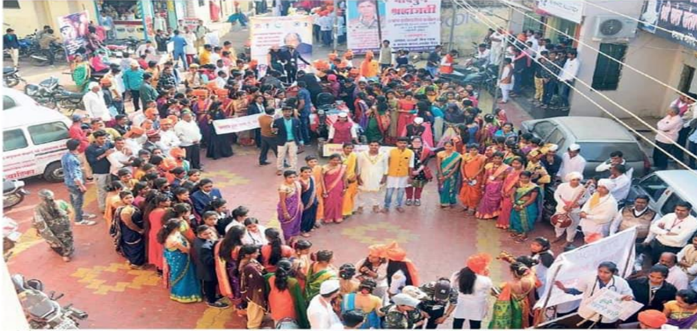
वडनेरभैरव : गावफेरीत विविध सामाजिक विषयांवर जनजागृती करणारे देखावे व चित्ररथ.