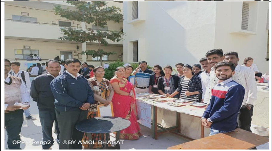
Funfair at Youth festival