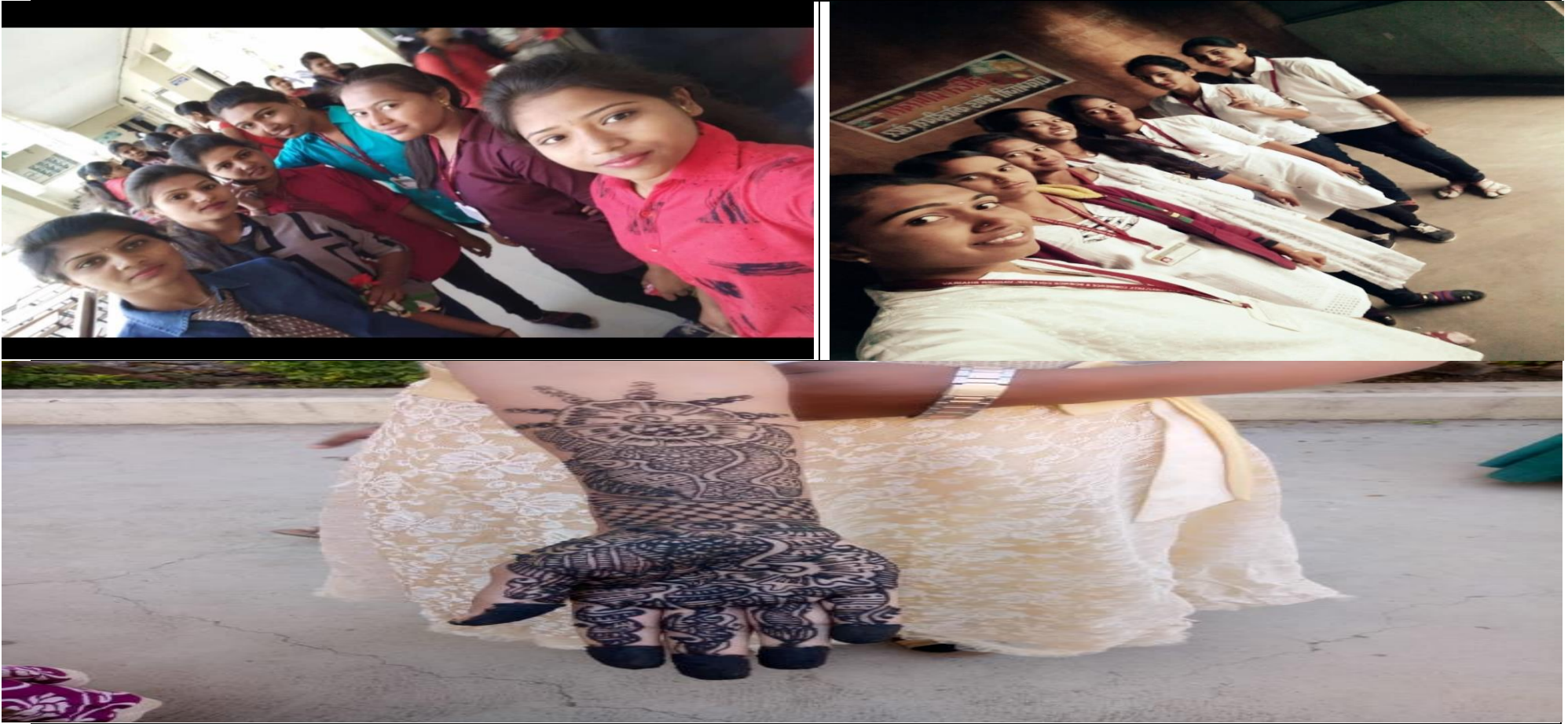
Students Participated Tie Day & Mehendi Competition