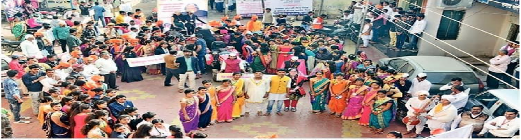
वडनेरभैरव येथील मराठा विद्या प्रसारक समाज संचालित कला व वाणिज्य महाविद्यालयातील विद्यार्थ्यांनी समाज जागृतीसाठी काढलेली गावफेरी.