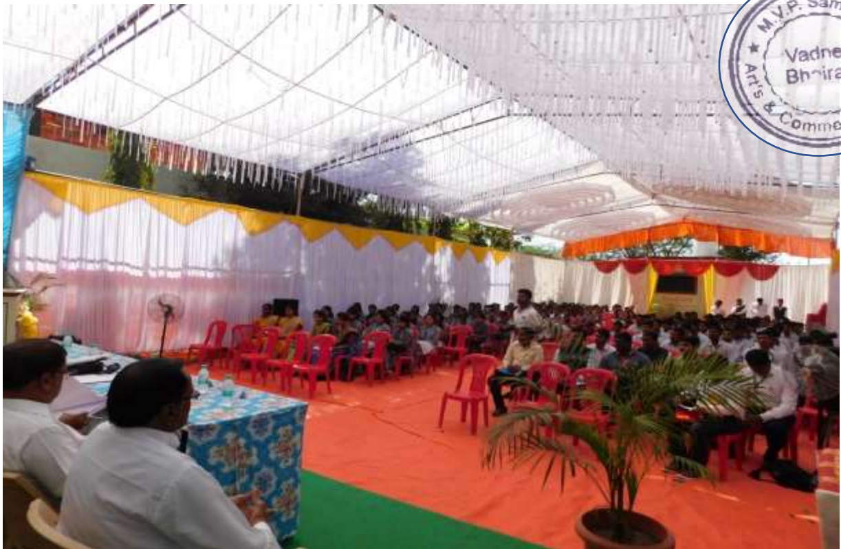
On this occasion students were present