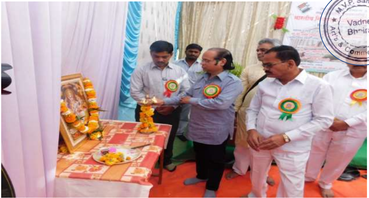
One Day's State Level Seminar was started with for worshiping of goddess Sarasvati.