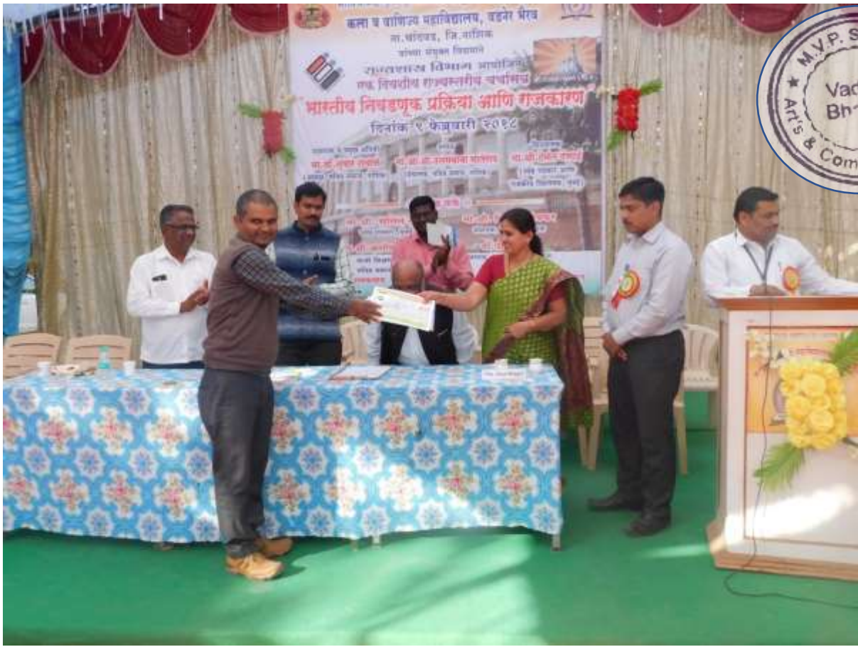
Certificate Distribution Function