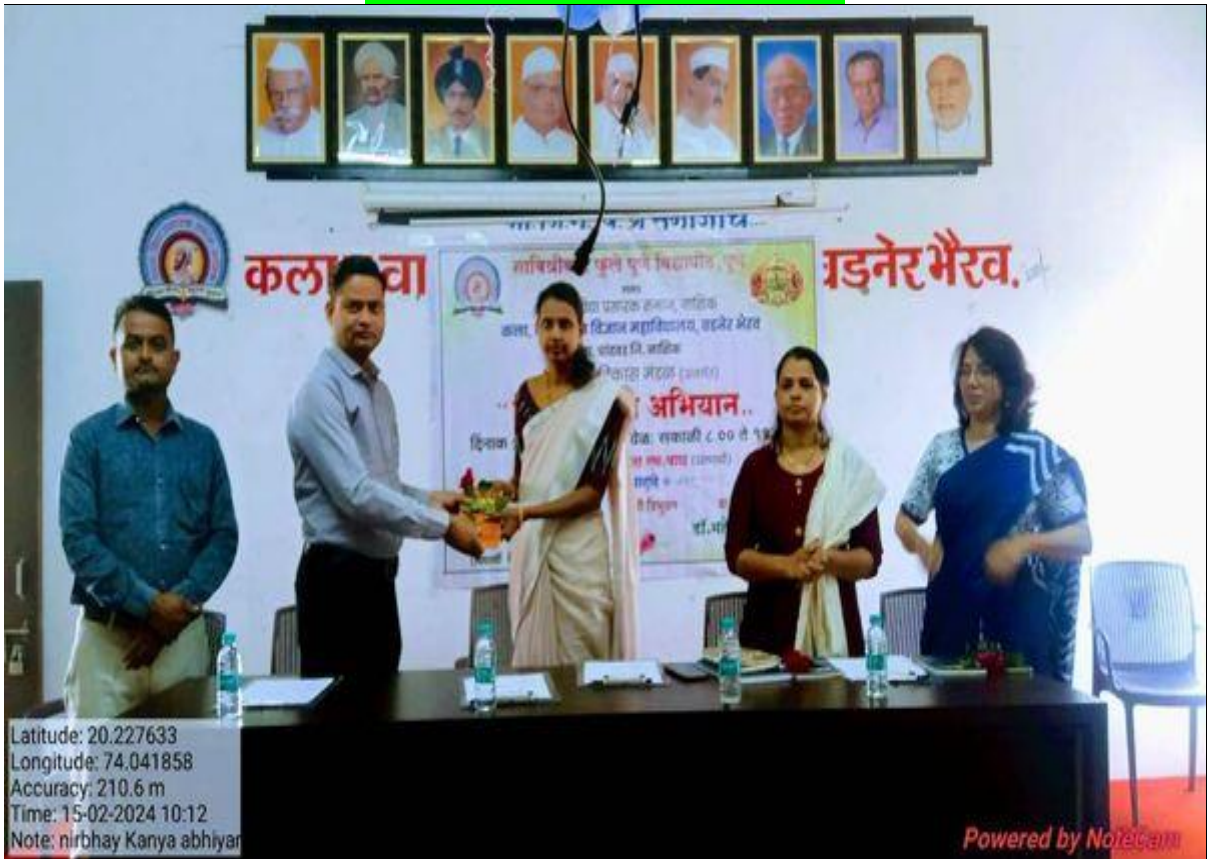
निर्भय कन्या अभियान कार्यक्रम

Latitude: 20.227633 Longitude: 74.041858 Accuracy: 210.6 m Time: 15-02-2024 10:12 Note: nirbhay Kanya abhiyan