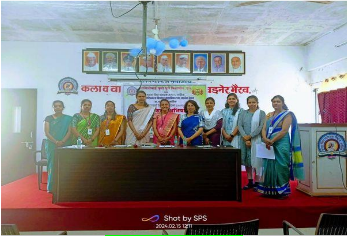
निर्भय कन्या अभियान कार्यक्रम