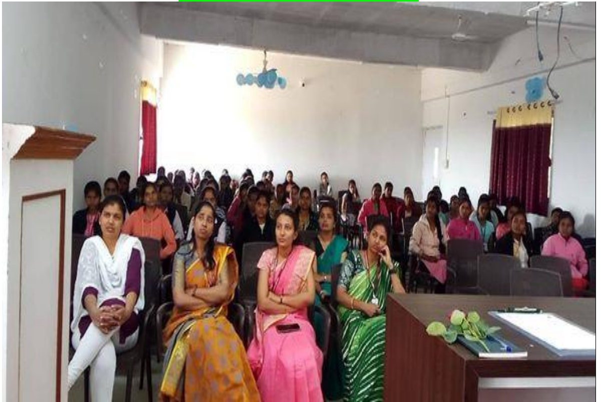
निर्भय कन्या अभियान कार्यक्रम